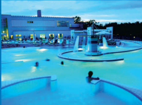
Großes Kurhaus Bad Füssing

Tagen in Bad Füssing, Europas beliebtestem Kurort